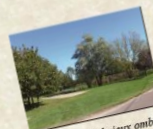
Mare avec aire de jeux ombragée, terrain de pétanque

Sentier de randonnées Dame Renaude de 10,5 km